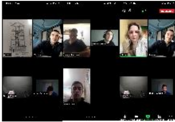
Рисунок 2 – Навчальна група у дистанційному навчанні з фахової дисципліни

Тому вважаю, що викладачі чи профільні майстри навчального закладу можуть впевнено користуватись безкоштовними платформами при підготовці електронного навчального матеріалу, відео лекцій та формування тематичних кейсів для дистанційного викладання профільного матеріалу, а також для створення тестів і профільних опитувань навчальної групи.