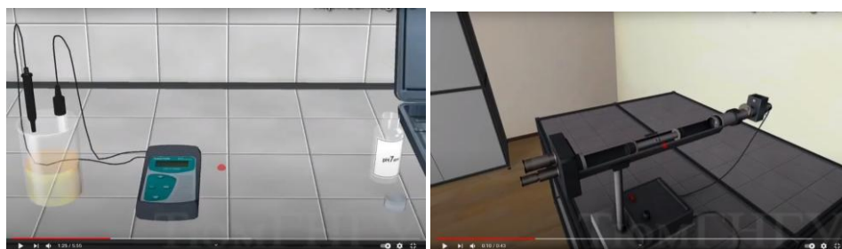
Рис. 2. Скриншоти фрагментів віртуальних лабораторних робіт

Так, під час вивчення теми «Електрохімія» та «Хімічна кінетика» в умовах дистанційного навчання не можливо виконати лабораторні роботи «рН-метрія» та «Кінетика кислотного гідролізу сахарози», тоді на допомогу приходить віртуальна лабораторія (рис.2). Проте, таких програмних продуктів, які забезпечують дисципліну «Фізична та колоїдна хімія» віртуальними лабораторними роботами не так вже й багато. Серед них заслуговує увагу VirtLab.